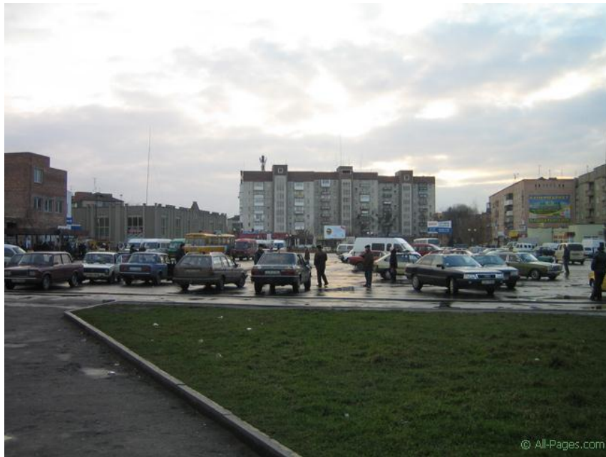
Привокзальная площадь города Ковеля.