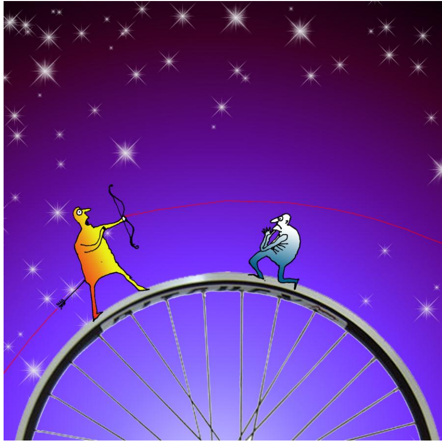
Рисунок Виктора Богорада

До института я работал на приборостроительном заводе в областном городе Луцке на Украине. Родители жили в деревне Тойкут, там я за три года до этого закончил школу. Всего-то около ста километров, не бог весть какое расстояние, особенно по сегодняшним меркам, но выбирался я к ним не часто. Прямого сообщения между Луцком и деревней не было, приходилось пересаживаться в райцентре, городе Ковеле. Вот это и было неприятным – автобусы ходили редко, втиснуться было трудно. Поехать домой я мог только в свой единственный выходной – воскресенье, суббота была рабочая. Но в воскресенье в Ковеле был базарный день, из окрестных сел поездом рано утром приезжала уйма народу, а потом все старались уехать домой пораньше. Либо на попутке, без какой-либо гарантии, что она подвернется, либо в переполненном пригородном автобусе, тоже без гарантии, что удастся сесть.