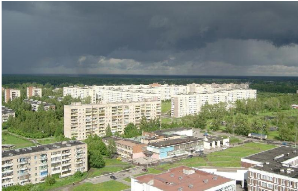
Поселок Металлострой. Вид с 23-х этажного высотного дома. ( http://metallostroy.org/new/1274665448/gallery_2_7_68541.jpg )