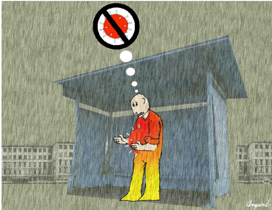
Рисунок Виктора Богорада